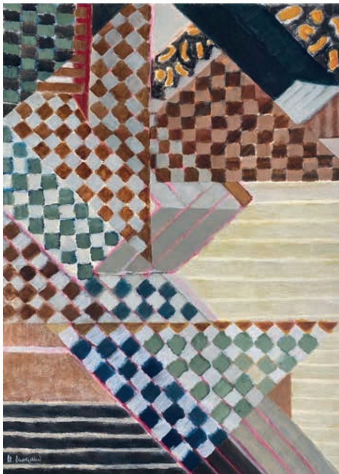
ALICATADO II • acrílico sobre papel, 70 x 50 cms., 2020

Desde la Fundación Provincial de Cultura entendemos nuestra Sala Rivadavia como una plataforma desde la que dar difusión y visibilidad al mejor arte actual, tanto de artistas de nuestra provincia como de fuera de ella, siempre que la calidad del trabajo mostrado, requisito indispensable para formar parte de nuestra programación, sea indudable y evidente. Son numerosas las ocasiones en las que nos alegramos de llevar hasta los paneles de este espacio expositivo la obra de artistas jóvenes, nuevas promesas que comienzan a dar sus primeros pasos en prometedoras carreras artísticas y que, esperamos, pueden convertirse en nombres propios del panorama artístico español en unos años. Y otras veces nos ocurre justamente lo contrario, nos gusta reconocer con una exposición el trabajo de grandes artistas, artistas de aquí que, con largas carreras llenas de éxitos, han llevado a gala el arte de nuestra tierra allá donde han tenido la oportunidad de mostrarlo.